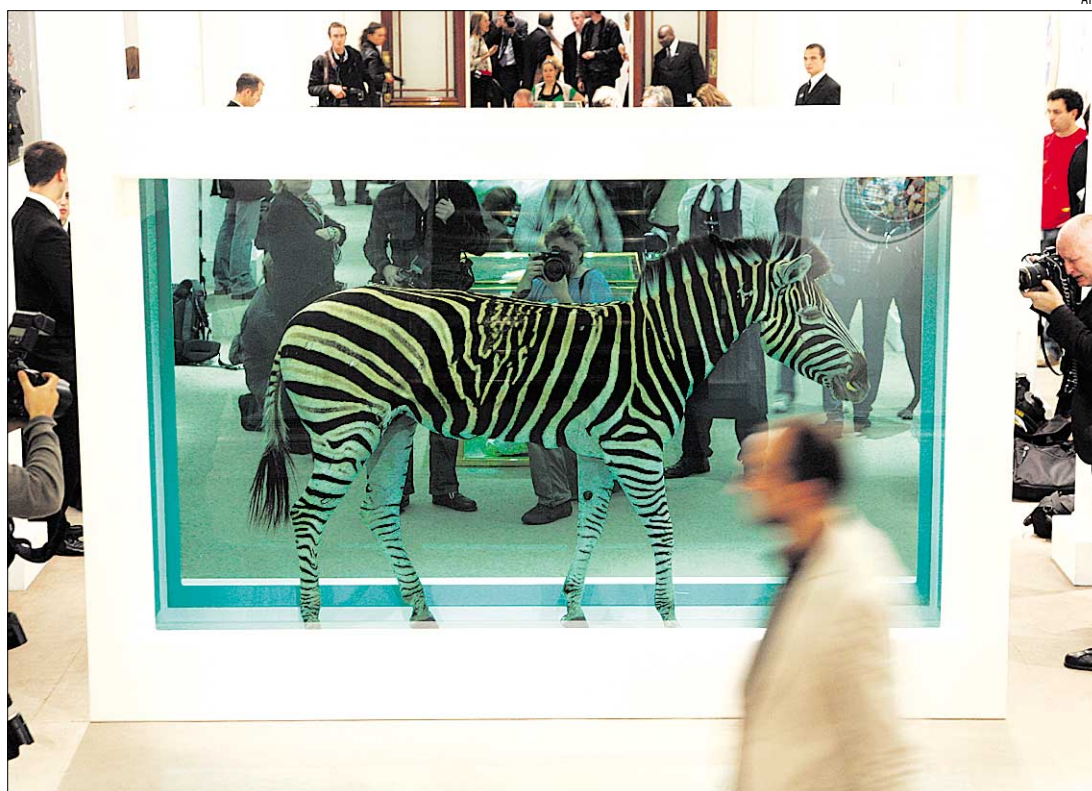
El británico Damien Hirst ha vendido en millones de dólares sus animales en formol.